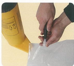
空気入れが楽 (口でも空気は入れられます)